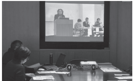
(家族会でZOOM配信視聴)